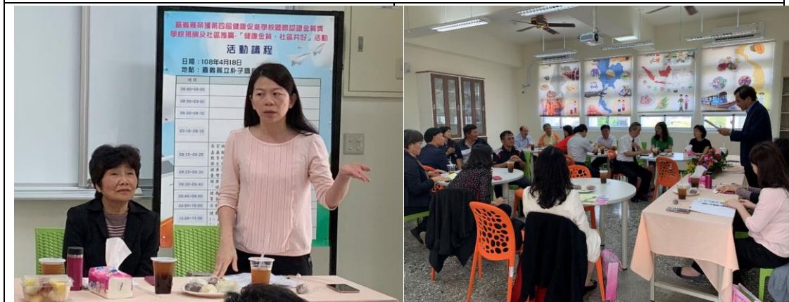
▲進行座談會分享推動健康促進學校的經驗