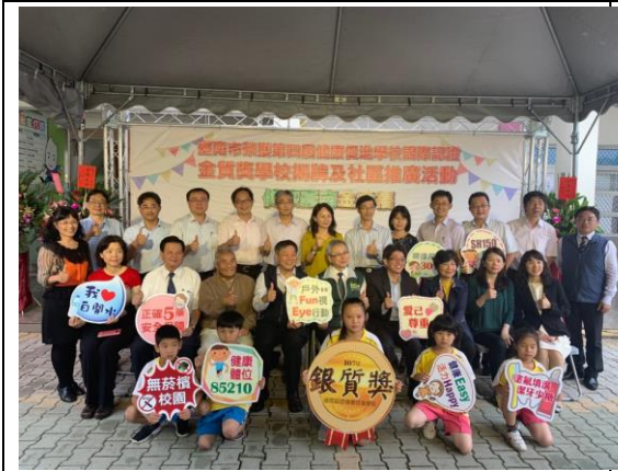
▲臺南市學校共榮獲一金十二銀二銅四推動嘉獎