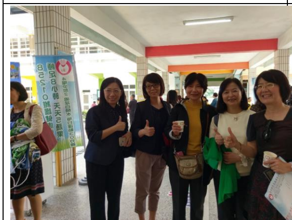
▲貴賓們對雲林縣廉使國小的努力給予一致肯定