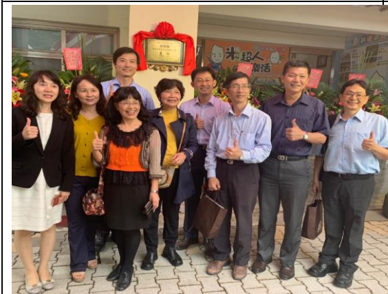
▲參加活動的貴賓們給予新嘉國小一致的肯定