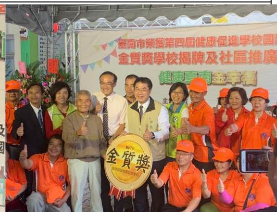
▲黃偉哲市長與現場來賓合影