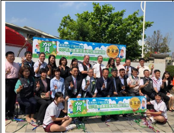
▲朴子國中榮獲金質獎

嘉義縣今年有朴子國中及菁埔國小獲獎金質獎，另有 11 所學校分獲銀、銅獎及其它獎項，是這次認證活動的全國最大贏家。