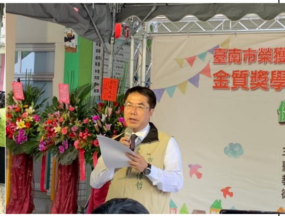
▲臺南市黃偉哲市長致辭