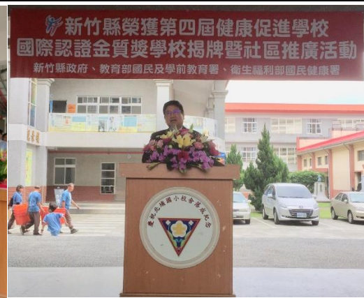
▲新竹縣楊文科縣長致辭