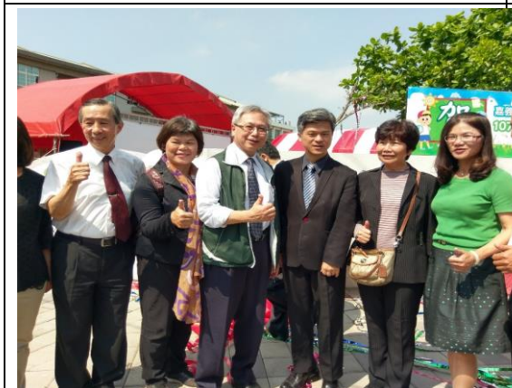
▲參加活動的貴賓們對朴子國中給予一致的肯定