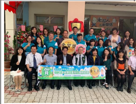
▲新嘉國小榮獲金質獎

健康促進學校國際認證至今共辦理四屆，臺南市合計獲得三金、十九銀、十五銅及四推動嘉獎，今年更是大放異彩，榮獲一金十二銀二銅四推動嘉獎，獲獎學校數居全國之冠。