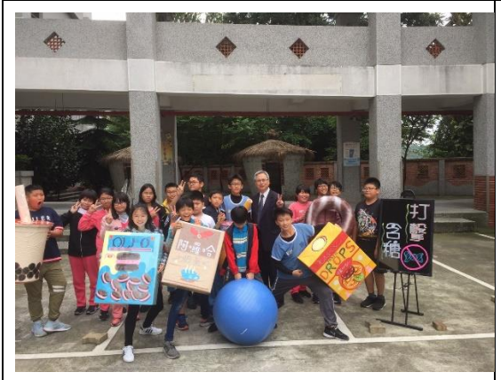
▲健康知識互動遊戲