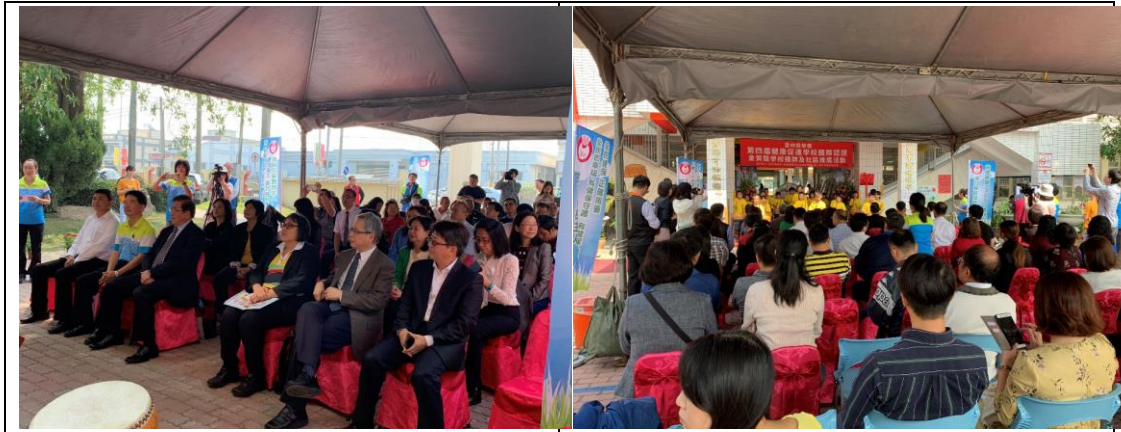
▲中央與地方各界貴賓，家長及社區民眾共同參與本次活動

參加揭牌典禮的貴賓們，對學校在健康促進上所做的努力給予一致的肯定，並宣示健康促進要請家長、社區民眾大家一起來實踐。