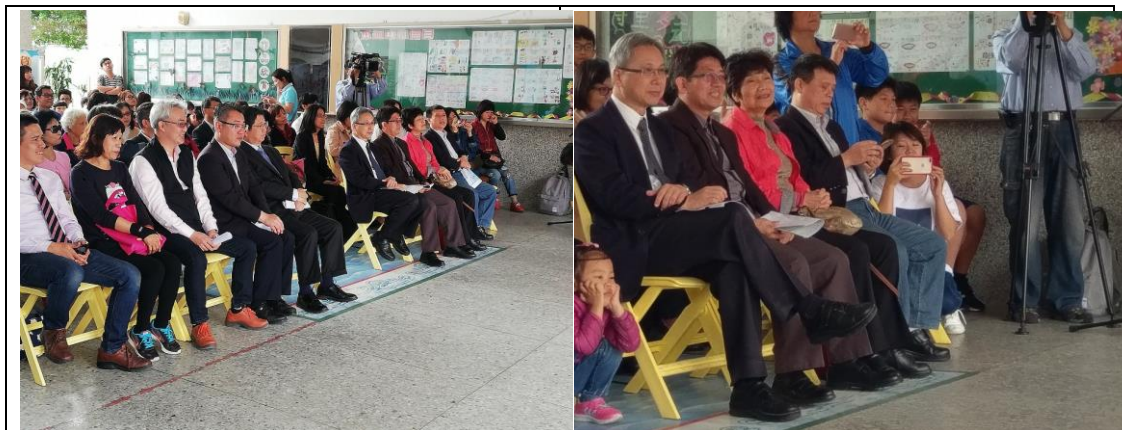
▲中央與地方各界貴賓，家長及社區民眾共同參與本次活動

新竹縣北埔國小於榮獲金質獎及特色議題加值方案(健康體位議題)優良獎雙重榮耀，縣長楊文科 4 月 15 日為學校主持金質獎揭牌活動。