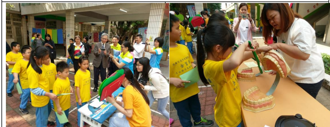
▲同學們積極參與各項健康促進闖關活動