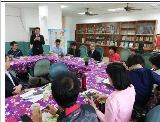
▲座談會進行健康促進相關的分享與討論