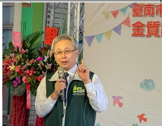
▲衛生福利部國民健康署王英偉署長致辭