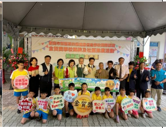
▲新嘉國小榮獲金質獎