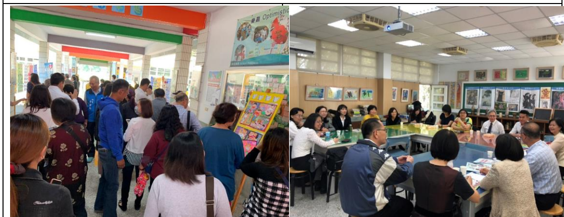
▲健康促進宣導參觀以及座談會經驗分享與交流