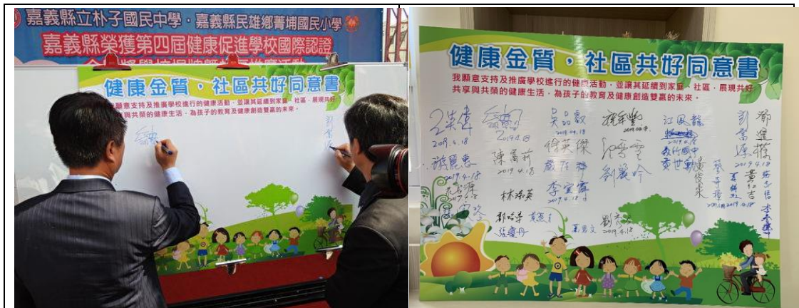
▲與會嘉賓及家長和學生共同簽署「健康金質，社區共好結盟」同意書

與會嘉賓以及家長和學生共同簽署「健康金質，社區共好結盟」同意書，並於活動中分享推動健康促進學校的經驗，將健康促進融入生活中落實，延續到家庭、社區。