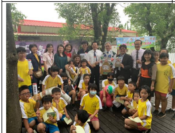
▲來賓與師生同樂合影