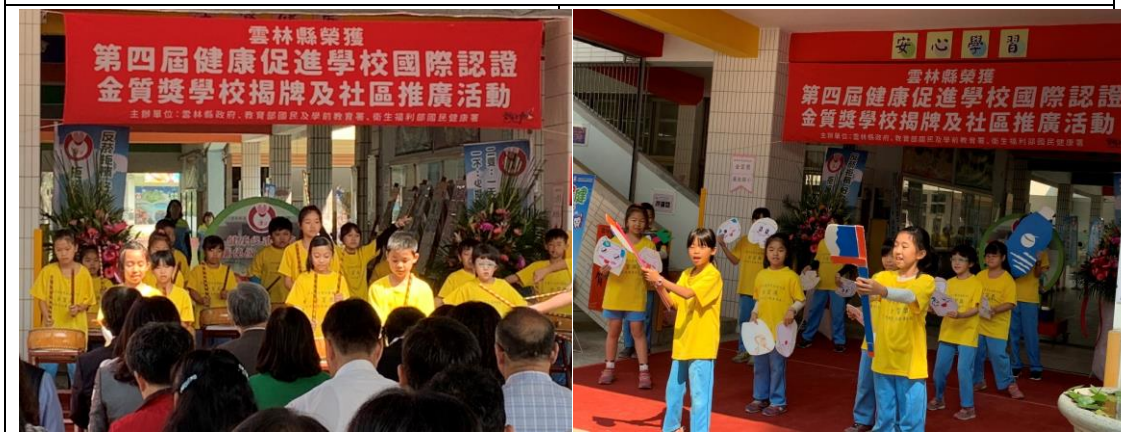
▲活動在廉使國小太鼓表演及口腔衛生潔牙舞蹈演出中揭開序幕