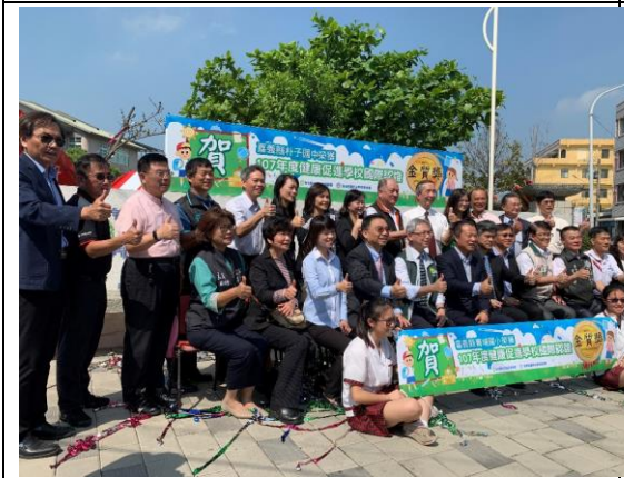
▲嘉義縣共有 11 所學校分獲金、銀、銅獎及其它獎項