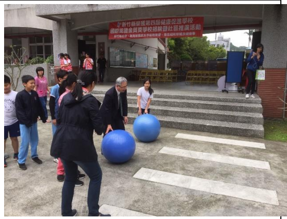
▲健康知識互動遊戲