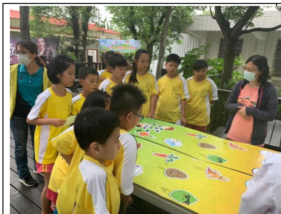
▲學生參加闖關活動

活動當天校園內更舉辦多項健康促進闖關活動，現場來賓和學校師生都積極參與。同時並舉辦一場校園健康促進推廣座談，邀請與會來賓進行經驗分享。