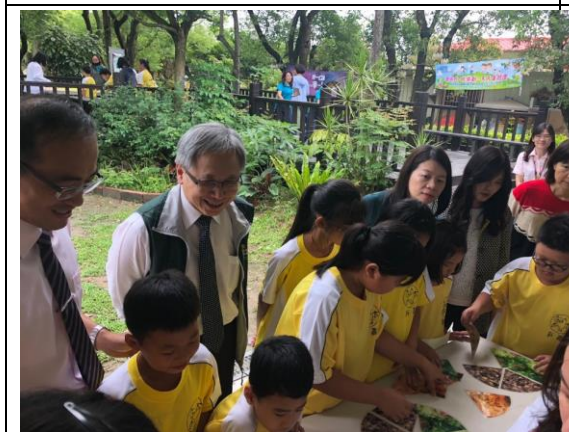
▲來賓參與學生闖關活動