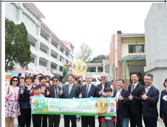
▲參加活動的貴賓們對北埔國小給予一致肯定