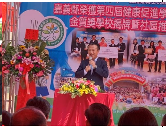
▲嘉義縣翁章梁縣長致辭