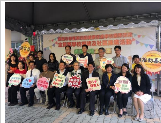
▲臺南市學校共榮獲一金十二銀二銅四推動嘉獎