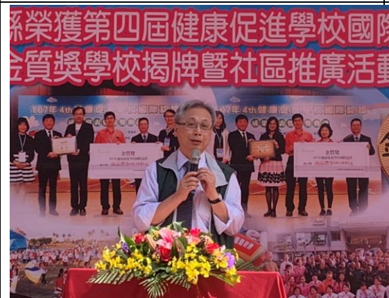
▲衛生福利部國民健康署王英偉署長致辭