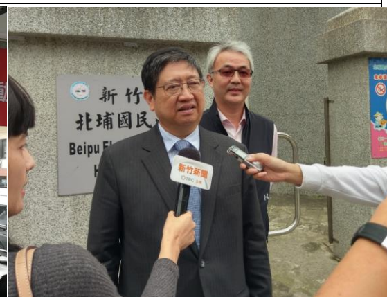
▲新竹縣楊文科縣長接受媒體記者採訪