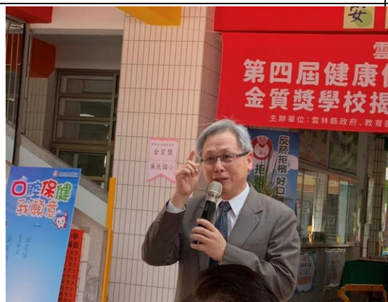
▲衛生福利部國民健康署王英偉署長致辭