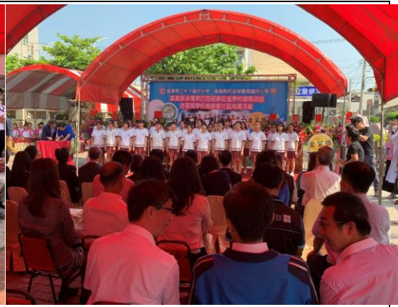
▲中央與地方各界貴賓，家長及社區民眾共同參與本次活動