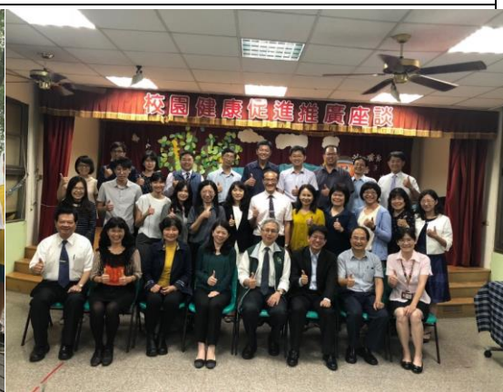
▲與會人員會後合影