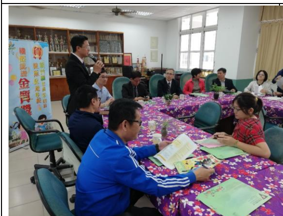
▲座談會進行健康促進相關的分享與討論