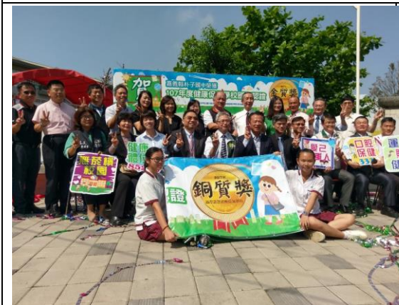
▲嘉義縣共有 11 所學校分獲金、銀、銅獎及其它獎項