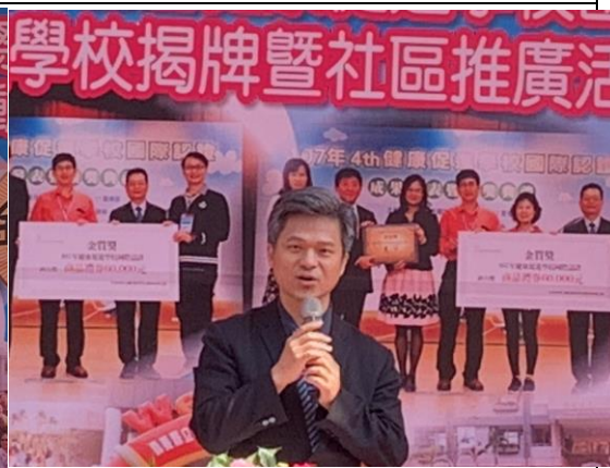
▲教育部國民及學前教育署彭富源署長致辭