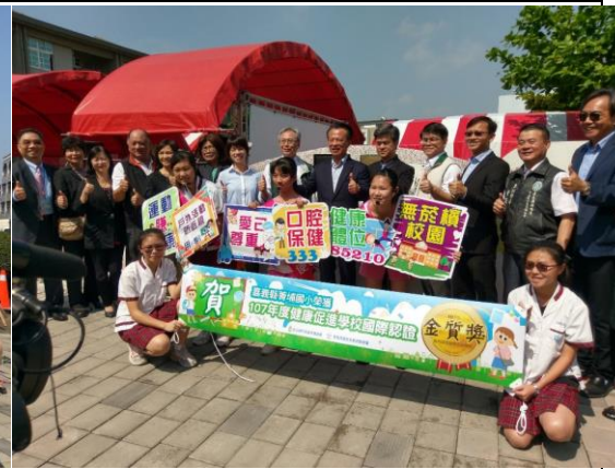
▲菁埔國小榮獲金質獎