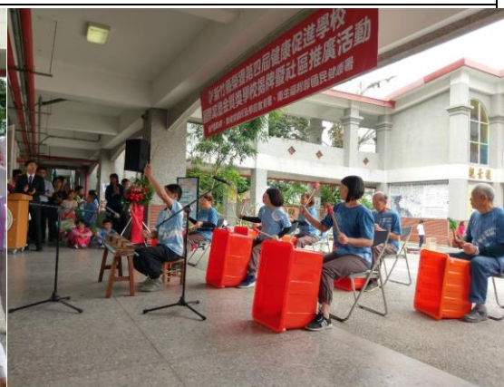
▲社區長輩「鹹菜桶」打擊樂曲