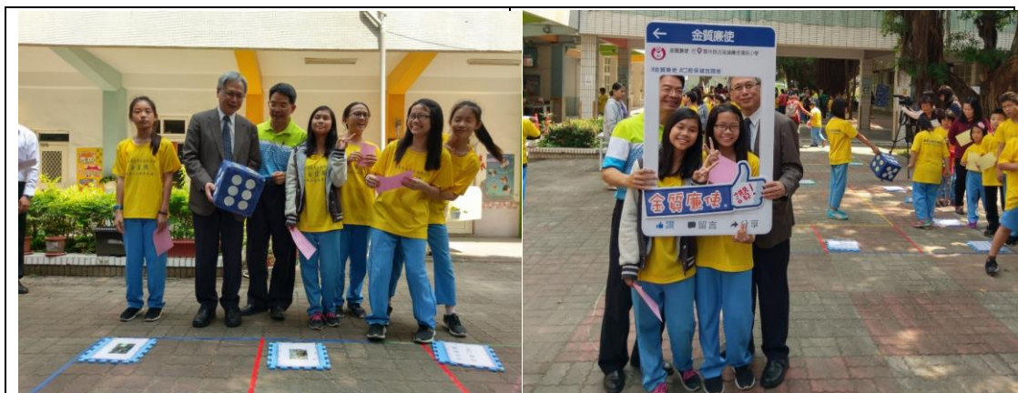
▲到場貴賓與校長、學生同樂，一起玩遊戲與拍照打卡

當天在校園內並設置了各種宣導攤位與小遊戲，讓與會貴賓、學校師生、家長、社區人士一起進行健康促進闖關活動，以及分享。交流。