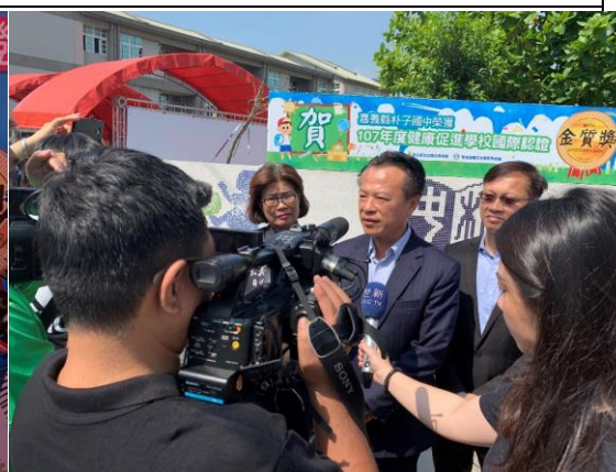
▲嘉義縣翁章梁縣長接受媒體記者採訪