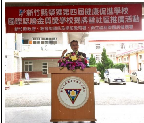
▲衛生福利部國民健康署王英偉署長致辭