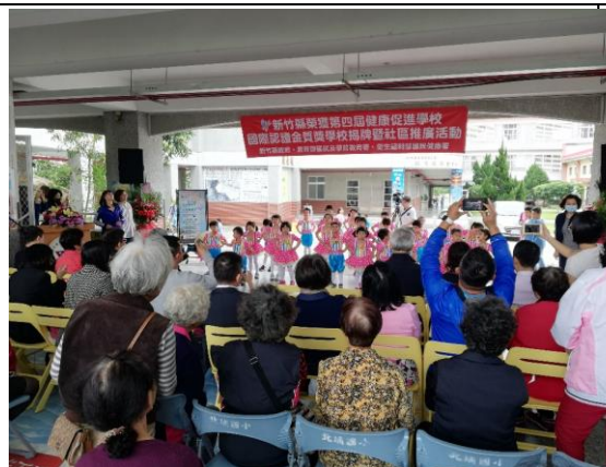
▲北埔國小學生帶來各項表演為活動揭開序幕